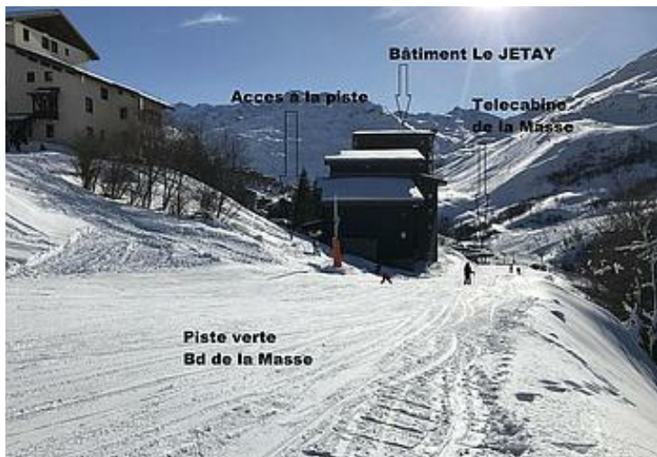
Bâtiment Le JETAY