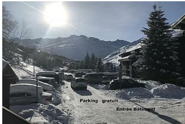
Parking gratuit Entrée Bâtiment