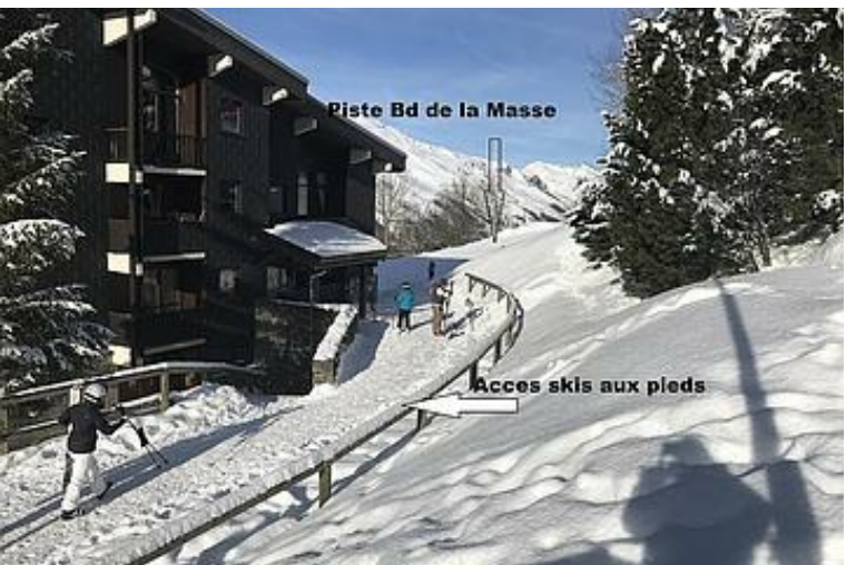
Piste Bd de la Masse